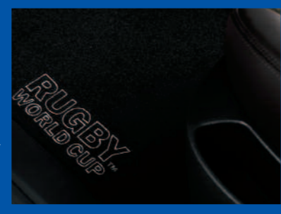
Surtapis avant et arrière avec monogramme