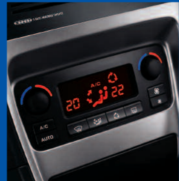
Air conditionné automatique bi-zone