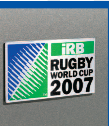
Badge Rugby World Cup 2007