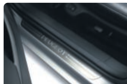
Protecteurs de seuil de porte Réalisés en acier inox brossé, ils s'intègrent parfaitement aux lignes de 407.