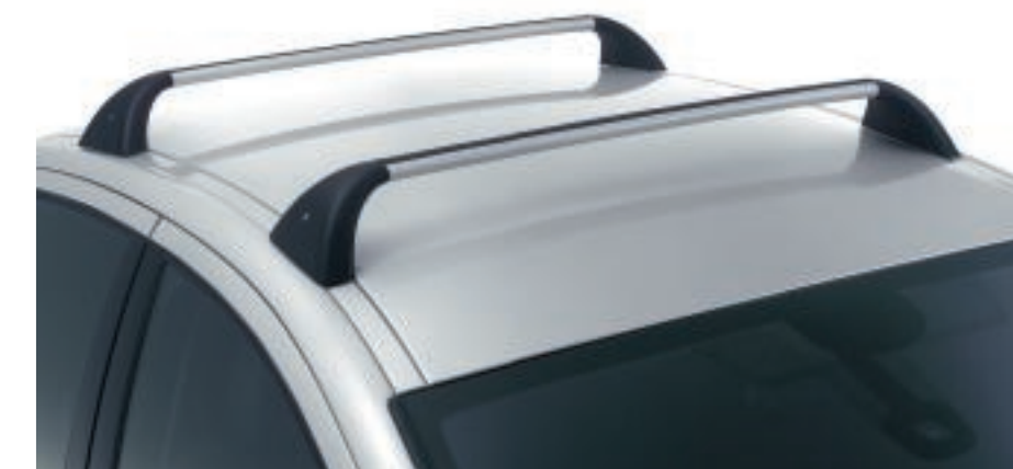
Barres de toit "Quick berline"

Votre 407 est faite pour vous emmener sur les routes du monde... Evadez-vous en toute confiance, en toute sécurité, en la dotant de ces accessoires faits pour accroître votre plaisir de voyager.