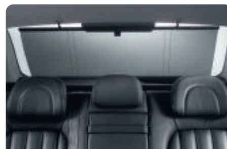
Store arrière berline Conçu pour 407, ce store avec enrouleur s'accorde avec l'ambiance intérieure. En occultant la lunette arrière, il protège l'habitacle des rayons du soleil.