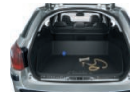
Grille pare-chien et bac de coffre SW Constitué d'un quadrillage en acier, la grille pare-chien sépare le compartiment arrière de l'habitacle.