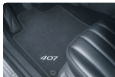
Jeu de surtapis classique

Fabriqués sur mesure, ces surtapis épousent la forme du plancher en venant se clipper simplement sur les fixations existantes. Ils sont pourvus du sigle 407 côté conducteur.