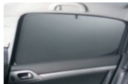
Stores pare-soleil latéraux Ces stores permettent une occultation totale des vitres latérales.

A l'image de ses surpiqures, son élégance est à la hauteur de vos exigences. En outre, ce volant vous offre une excellente préhension !