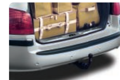
Atelage à rotule démontable sans outil Un simple geste permet d'enclencher ou d'éjecter la rotule de son boîtier. 407 retrouve alors sa ligne d'origine.

Ce jeu de barres se fixe automatiquement dans les ancrages du pavillon. Plus besoin de clé de serrage : les barres se verrouillent et se déverrouillent à l'aide d'une manette intégrée à chaque pied. Les capots de pieds verrouillables en assurent l'inviolabilité.