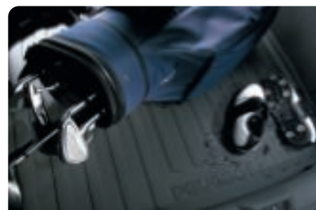
Bac de coffre berline Très facile à manipuler, ce bac en matériau thermoformé se pose dans le coffre sans se fixer. Il épouse les contours et son entretien est aisé.