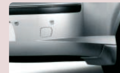
Aide sonore au stationnement AR Discrets, ses 4 capteurs de proximité intégrés dans le pare-choc arrière vous apporteront une aide précieuse lors de vos manœuvres en marche arrière.