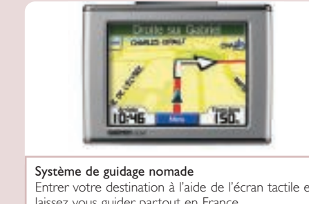
Système de guidage nomade Entrez votre destination à l'aide de l'écran tactile et laissez vous guider partout en France .