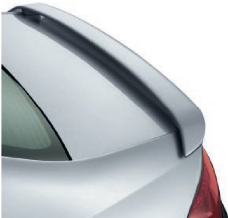
Aileron de coffre Dédié à 407, cet aileron en prolonge harmonieusement les lignes et souligne son caractère dynamique. Les matériaux employés garantissent une excellente tenue au vieillissement, aux contraintes climatiques et mécaniques. Cet accessoire est vendu non peint.