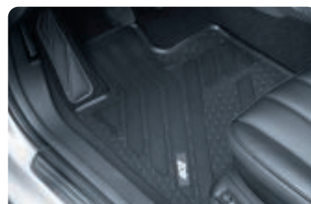
Jeu de surtapis caoutchouc

Fabriqués sur mesure, ces surtapis épousent la forme du plancher en venant se clipper simplement sur les fixations existantes. Ils sont pourvus du sigle 407 côté conducteur.