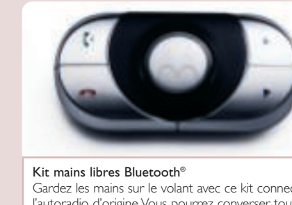
Kit mains libres Bluetooth® Gardez les mains sur le volant avec ce kit connecté à l'autoradio d'origine. Vous pourrez converser tout en laissant votre portable GSM compatible Bluetooth® dans votre poche ou votre sac à main.

Multimédia Peugeot a sélectionné pour 407 une gamme de produits high-tech : Changeur CD, lecteur DVD, systèmes de navigation et kit mains libres Bluetooth®.