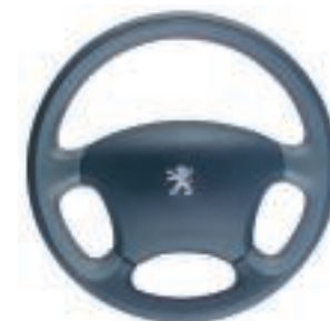
Volant cuir bi-ton

A l'image de ses surpiqures, son élégance est à la hauteur de vos exigences. En outre, ce volant vous offre une excellente préhension !