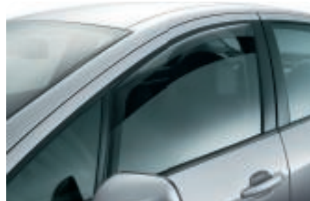
Déflecteur de portes avant Un excellent moyen d'améliorer votre confort et celui de vos passagers. Vous pourrez rouler avec les vitres entrebâillées sans courant d'air gênant.