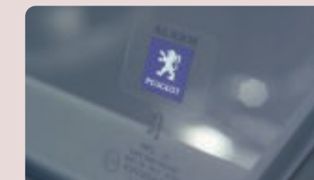
Alarme anti-intrusion sur radiocommande d'origine Dormez tranquille, cette alarme assure la protection de votre 407.

Les automobiles d'aujourd'hui accueillent les nouvelles technologies : profitez-en pour équiper votre 407 des tous derniers perfectionnements qui la rendront encore plus conviviale et agréable à conduire.