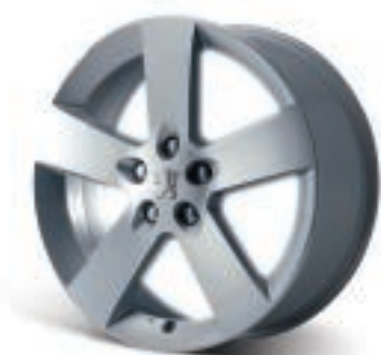
Roue alliage Hortaz 17"

Roues alliage Hortaz 16 et 17" chaînables Parmi les accessoires destinés à personnaliser votre véhicule, les roues alliage occupent une place privilégiée. A l'image de la roue Hortaz, spécifiquement étudiée et développée pour 407 et à la finition diamantée.