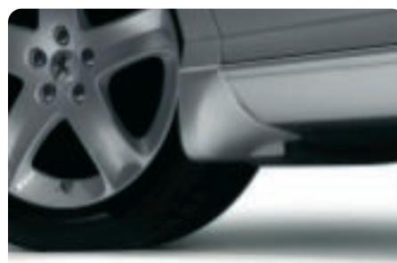
Bavette de style Particulièrement indiquées pour protéger votre 407 et les véhicules qui vous suivent, ces bavettes s'intègrent aux lignes de 407. Vendues non peintes.