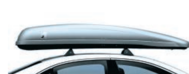
Coffre de toit Aérodynamique, il offre un grand volume utile. Ses ouvertures et fermetures latérales sont assistées par des vérins à gaz. La sécurité est assurée par une serrure centrale deux points.

Choisir 607, cela signifie préférer l'élégance au plus haut niveau. Adaptez cette élégance à vos propres exigences pour voyager et vivre vos loisirs dans les meilleures conditions.