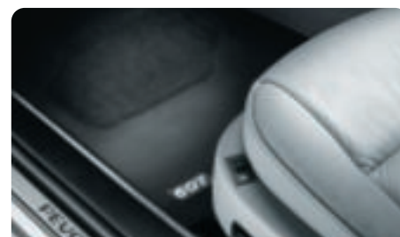
Jeu de surtapis Fabriqués sur mesure, ces surtapis épousent la forme du plancher en venant se clipper simplement sur les fixations existantes.