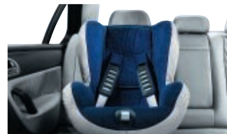
Siège enfant avec système d'ancrage Isofix 2 et 3 points Ce siège auto assure une protection optimale des tout-petits, de 9 à 18 kg.