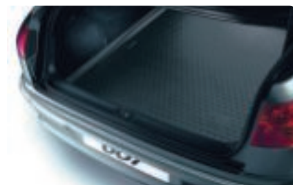
Bac de coffre Réalisé dans une matière résistante et antidérapante, ce bac offre une excellente protection et est d'un entretien aisé.