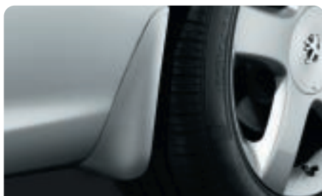
Bavettes de style Particulièrement indiquées pour protéger votre 607 et les véhicules qui vous suivent, ces bavettes évitent les projections de boue et de gravillons. Livrées non peintes.