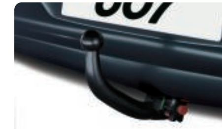
Attelage à rotule démontable sans outil Un simple geste, sans utiliser le moindre outil, suffit pour enclencher ou éjecter la rotule de son boîtier. Discret, cet attelage respecte l'élégance de 607.