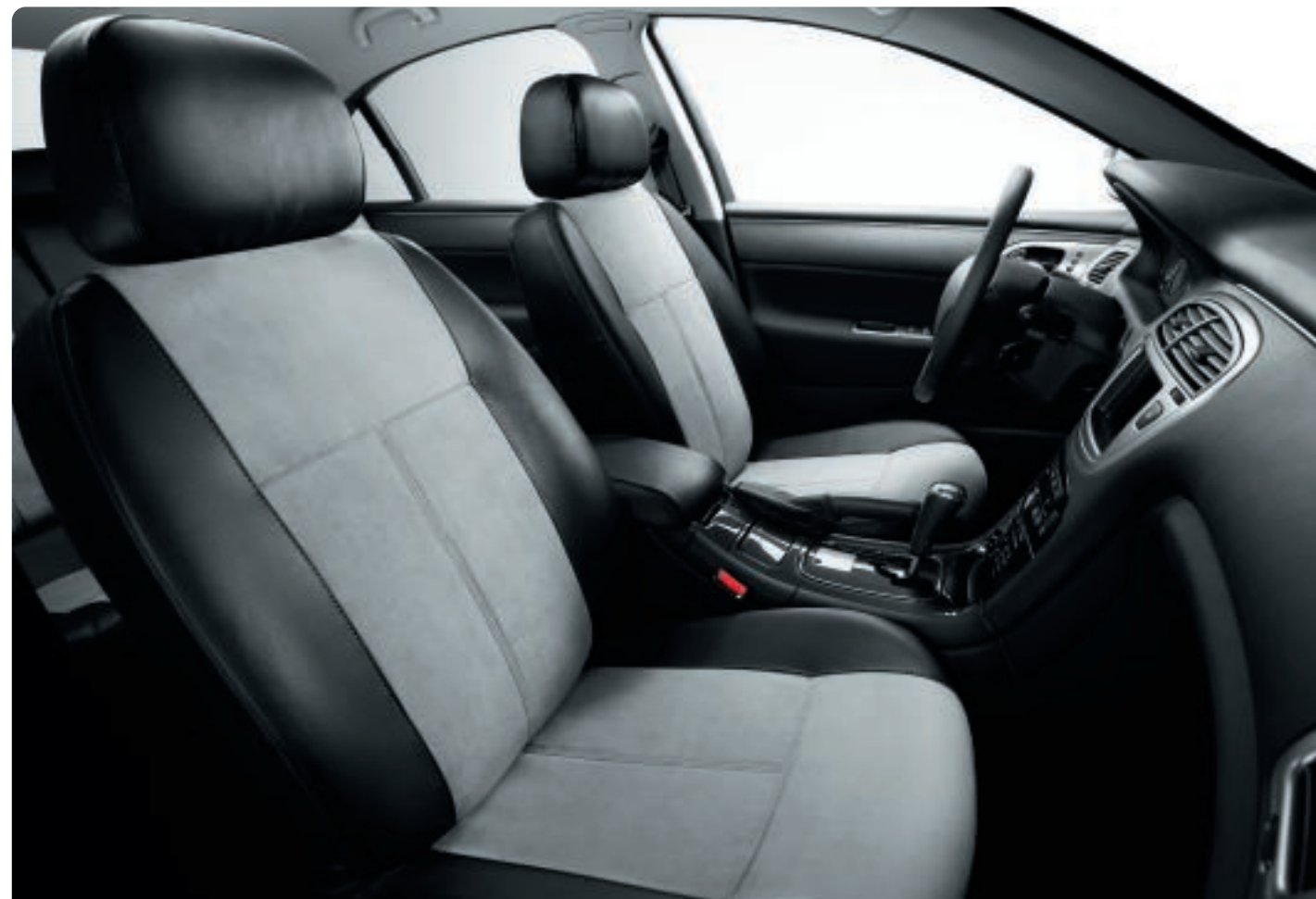
Housses de siège Fusion Confectionnées sur mesure pour 607, ces housses en velours microfibras façon Alcantara se montent rapidement, sans crochet, et sont compatibles avec les airbags latéraux.

Pour apprécier plus encore l'exceptionnel confort de votre 607, habillez-la de ces tenues d'intérieur qui s'accordent si bien avec son espace généreux et ses nombreux équipements.