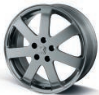
Roue alliage Eighteen 18" Elle apporte une touche supplémentaire de sportivité et de classe qui se remarque au premier coup d'œil. Non chaînable.

Le design 607 : une harmonieuse alliance de puissance et d'élégance, d'assurance et d'excellence. Intensifiez d'un trait de personnalité sa silhouette qui fait rêver.