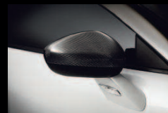
Coques de rétroviseurs revêtues de carbone