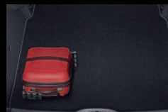
Tapis de coffre et cales