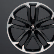
Solstice 19" Mat Black Onyx*

* Disponibles en option. Pneumatiques chaînables disponibles dans le réseau, adaptables sur les jantes 18".