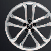
Solstice 19" Anthra Grey*