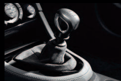
Soufflet en Alcantara et pommeau aluminium