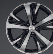
Technical 19" Grey*