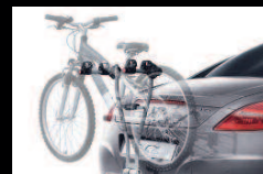
Attelage démontable sans outil et porte-vélos