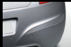
Bandeaux de protection