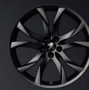
Sortilège 19" Mat Black Onyx*