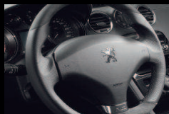
Volant sport en cuir et Alcantara