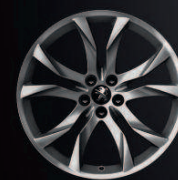
Sortilège 19" Midnight Silver*