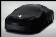
Housse de protection extérieure