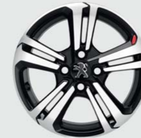
Jante alliage 15" Sport (1)