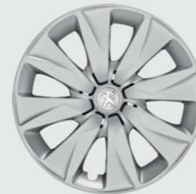
Enjoliveur 15" Brecola