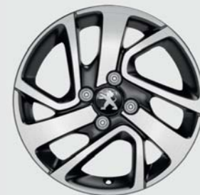
Jante alliage diamantée 15" Thorren