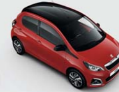
Bi-ton : Rouge Scarlett / Black Diamond