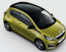
Bi-ton : Green Fizz / Black Diamond