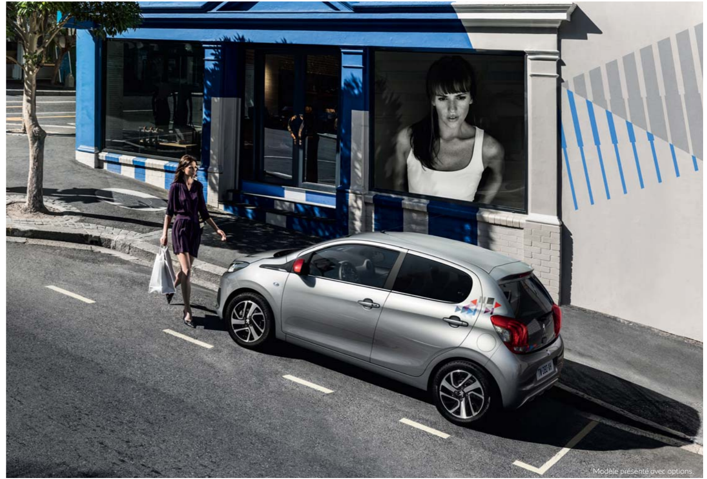
Modèle présenté avec options.