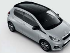
Bi-ton : Gris Gallium / Black Diamond