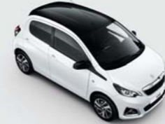
Bi-ton : Blanc Lipizan / Black Diamond