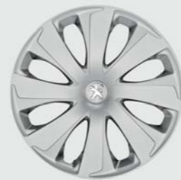
Enjoliveur 14" Xaurel

108 propose quatre modèles de jantes (2) et d'enjoliveurs (2) pour affirmer votre personnalité.