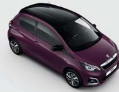
Bi-ton : Red Purple / Black Diamond

La PEUGEOT 108 se décline en huit teintes et la peinture bi-ton avec le toit Black Diamond* est disponible en sept versions sur la 108 berline 3 et 5 portes.