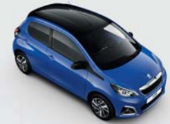
Bi-ton : Bleu Calvi / Black Diamond