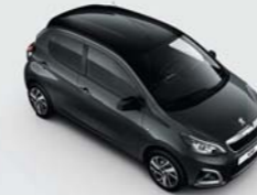
Bi-ton : Gris Carlinite / Black Diamond