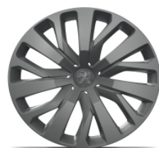
Enjoliveur Gris Anthra TONGARIRO