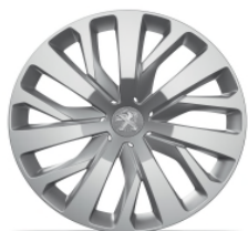
Enjoliveur Gris Eclat RAKIURA