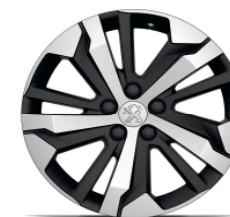
Jante alliage Gris Storm AORAKI