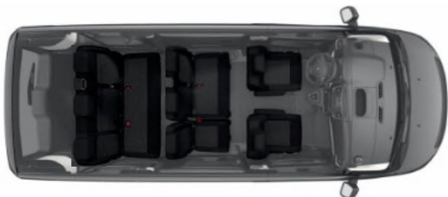
Configuration de série > 8 places