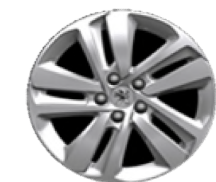
Jantes alliage 17" peintes Gris Eclat Cliquer