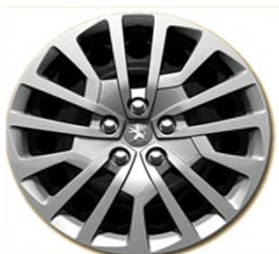
Enjoliveurs Full Cover 17" Miami