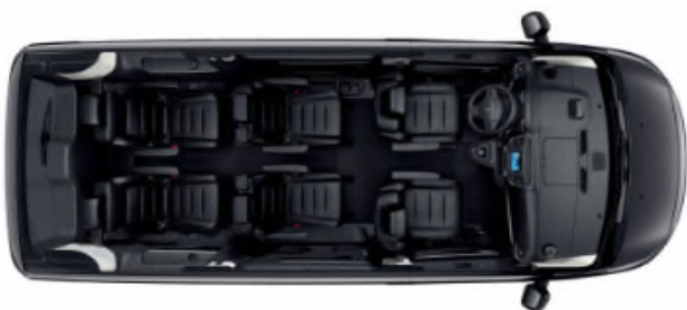
Configuration de série > 6 places