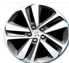
Jantes alliage 17" diamantées Phoenix