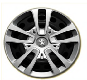
Enjoliveurs Full Cover 16" San Francisco