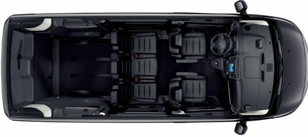
Configuration de série > 5 places