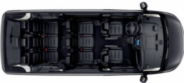
Configuration de série > 8 places