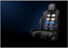
Pack Electrique & Massages

* Aktion Gesunder Rücken (Association Allemande pour la santé du dos) ● : Série ○ : Option - : Indisponible