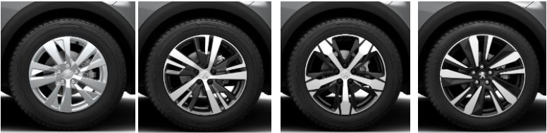
Jantes 17" 'Chicago' Jantes 18" 'Detroit' Jantes 18" 'Los Angeles' Jantes 19" 'Washington'