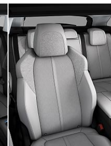
TEP & Tissu 'Evron' Guerande