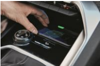
Recharge smartphone sans fil