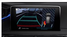
Pack City 1