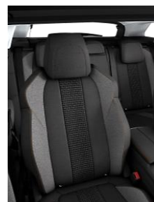
Tissu 'Meco' Mistral