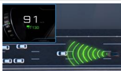
Pack Drive Assist