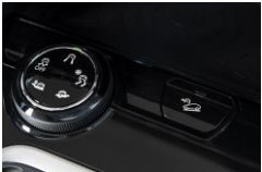
Advanced Grip Control