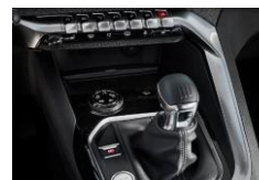
Boîte Manuelle BVM6

Prix Conseillés TTC : Le tarif comprend les frais de transport, de préparation, le jeu de plaques d'immatriculation définitives (pose comprise) et 5 litres de carburant. La carte grise est à la charge de l'acheteur.