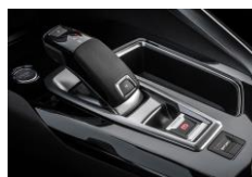
Nouvelle Boîte Automatique EAT8

**** Données provisoires en cours d'homologation