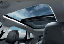
Toit ouvrant panoramique