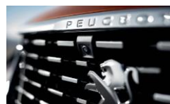
Pack City 2