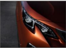
Peugeot Full LED Technology