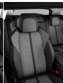
TEP & Tissu 'Piedimonte' Mistral