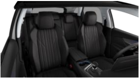
Pack Cuir 'Claudia'