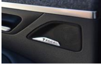
Système Hi-Fi Premium FOCAL®