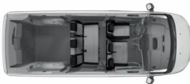
Configuration 6 places > option AL40 + WACY