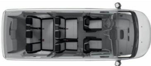
Configuration 8 places > option AN03