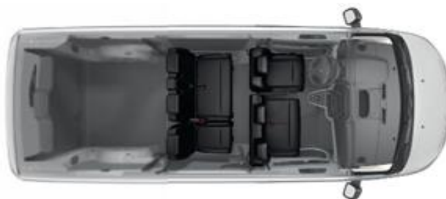
Configuration Pack Tep 6 places > Option 46FX*