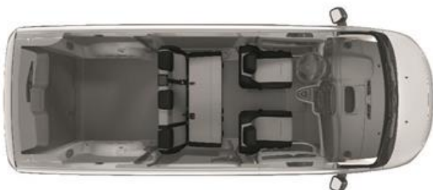
Configuration 5 places > option AL40