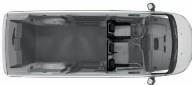
Configuration 3 places > option WACY