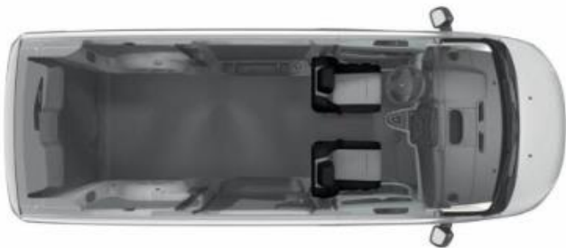
Configuration de série > 2 places