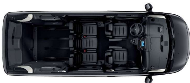
Configuration de série > 5 places