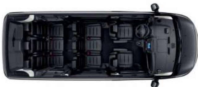
Configuration de série > 8 places