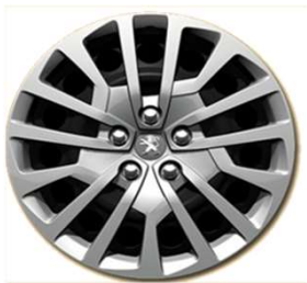
Enjoliveurs Full Cover 17"