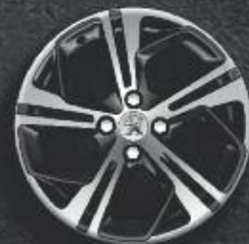
Jante 17" Carbone diamantée Noir Onyx* (verniss brillant)