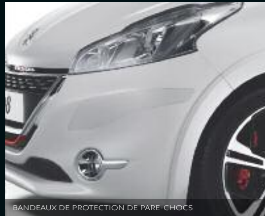
BANDEAUX DE PROTECTION DE PARE-CHOCS