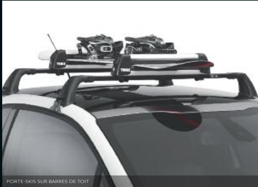
PORTE-SKIS SUR BARRES DE TOIT