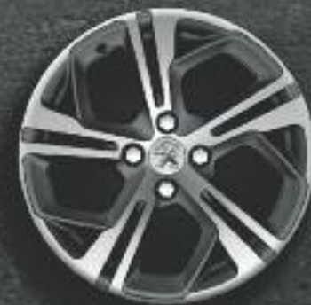
Jante 17" Carbone diamantée Storm (verniss mat)