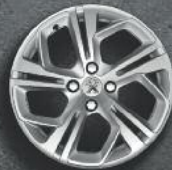
Jante 17" Carbone diamantée Etincelle* (verniss mat)

Découvrez les modèles de jantes spécifiques en option et de nombreux stickers de personnalisation. Agrémentez le capot ou le toit –qu’il soit en verre ou en tôle- d’un damier sportif et affichez vos couleurs sur le jonc de calandre. Véhicule présenté avec options.