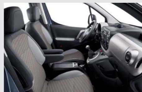
Ambiance Erable / Garnissage Spa (disponible sur niveaux Outdoor et Allure)